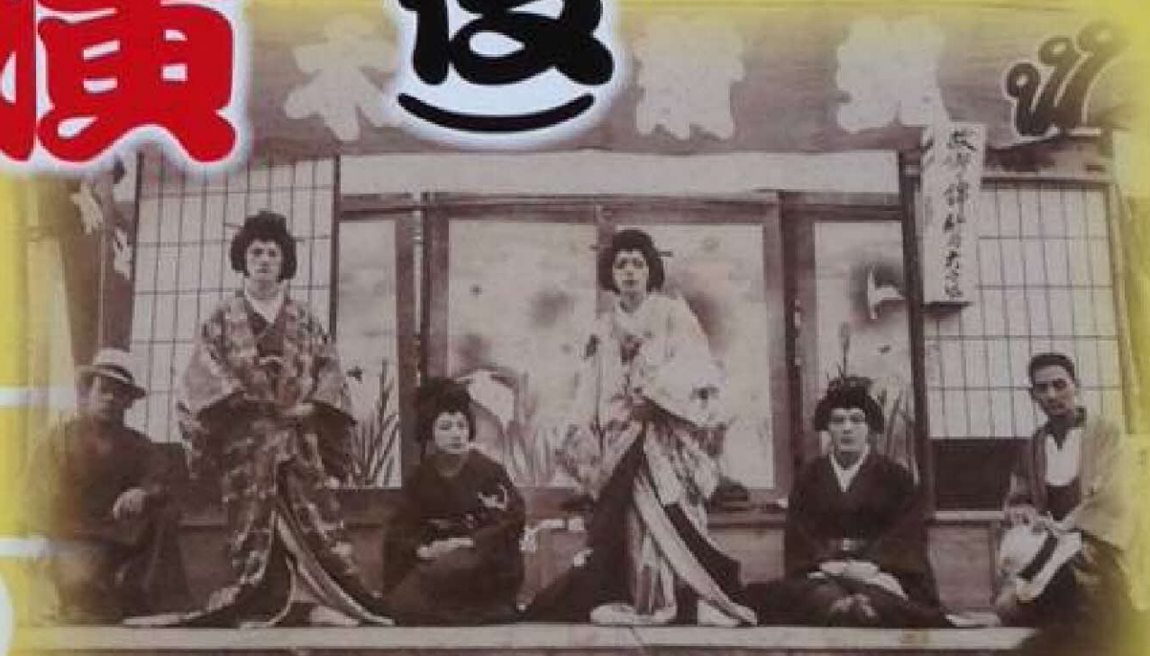
大正5年の野舞台での盆俄