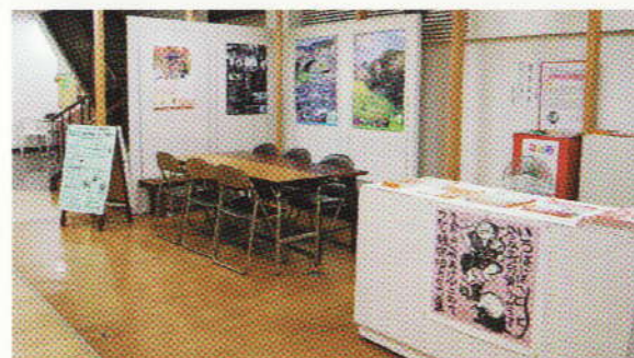
展示スペース・情報コーナー